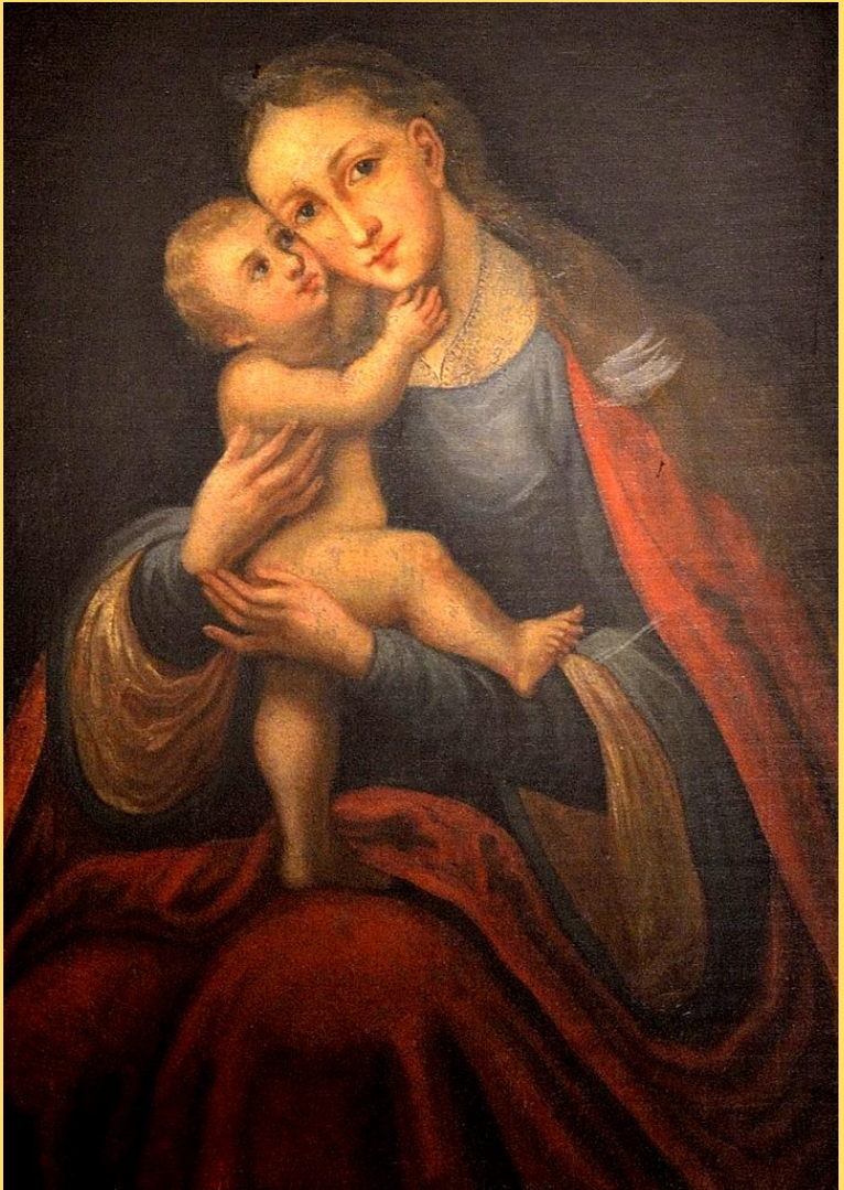
Das auf der nördlichen Wand hängende Mariahilf Gnadenbild ist eine Nachbildung des Originalgemäldes von Lucas Cranach , im Innsbrucker Dom